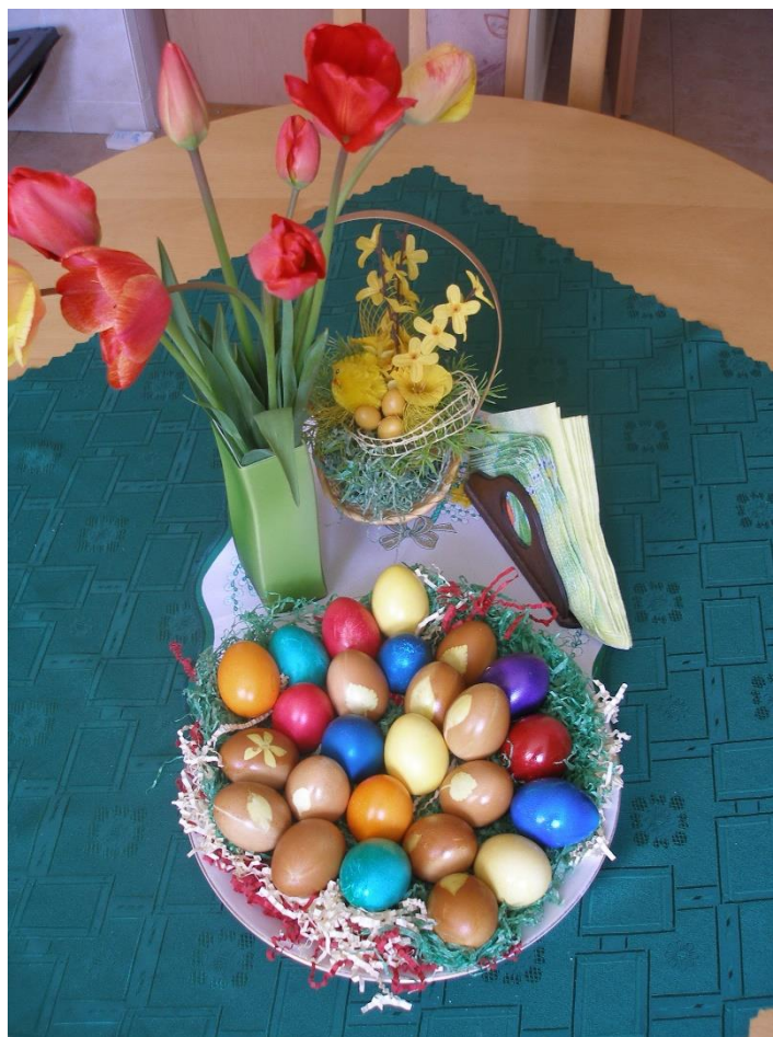
Obr. 7: Maľované vajčká a výzdoba na Veľkú noc u pani MIŠovej