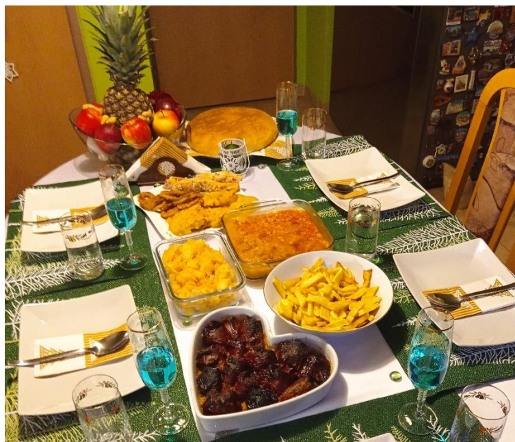
Obr. 3: Srbské Vianoce pani Mišovej na Slovensku 2