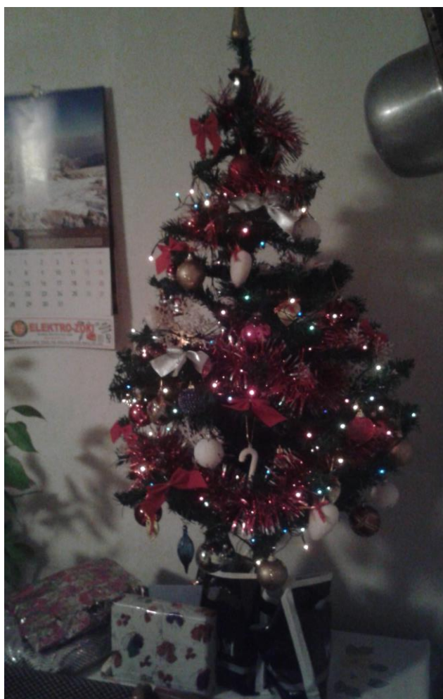
Obr. 4: Stromček Mgr. Mišovej v Srbsku