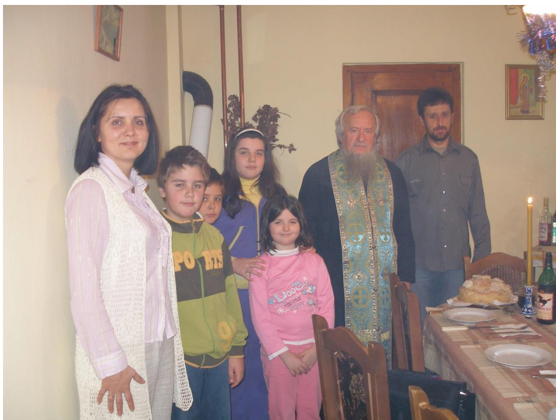
Obr. 10: Oslava Slavy u sestry Mgr. Mišovej