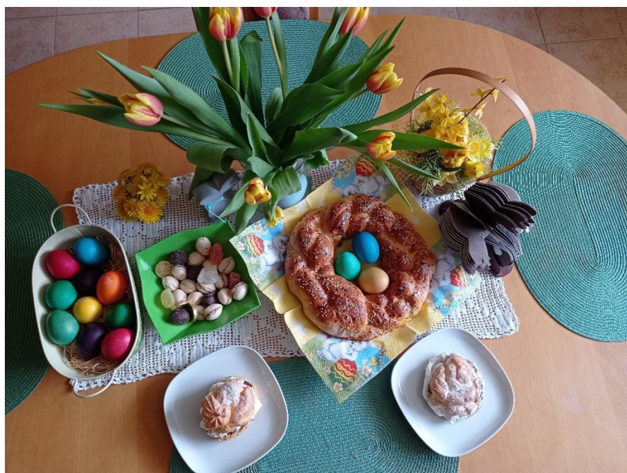
Obr. 8: Výzdoba na Veľkú noc u pani Mišovej na Slovensku