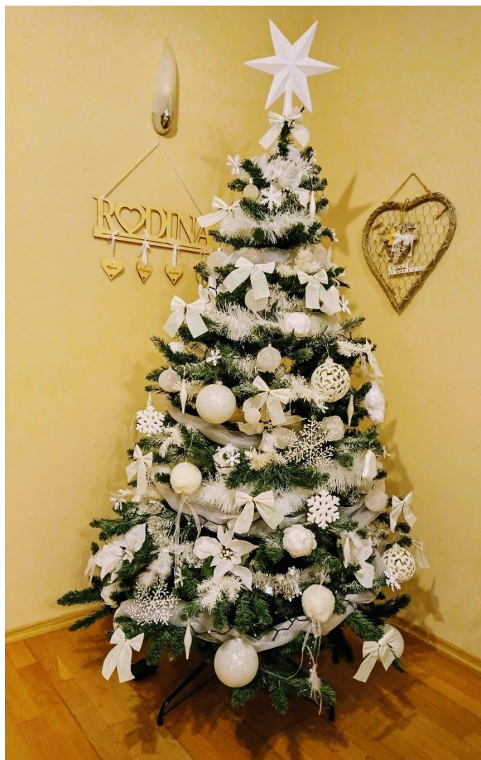
Obr. 5: Vianočný stromček rodiny Mišovej na Slovensku