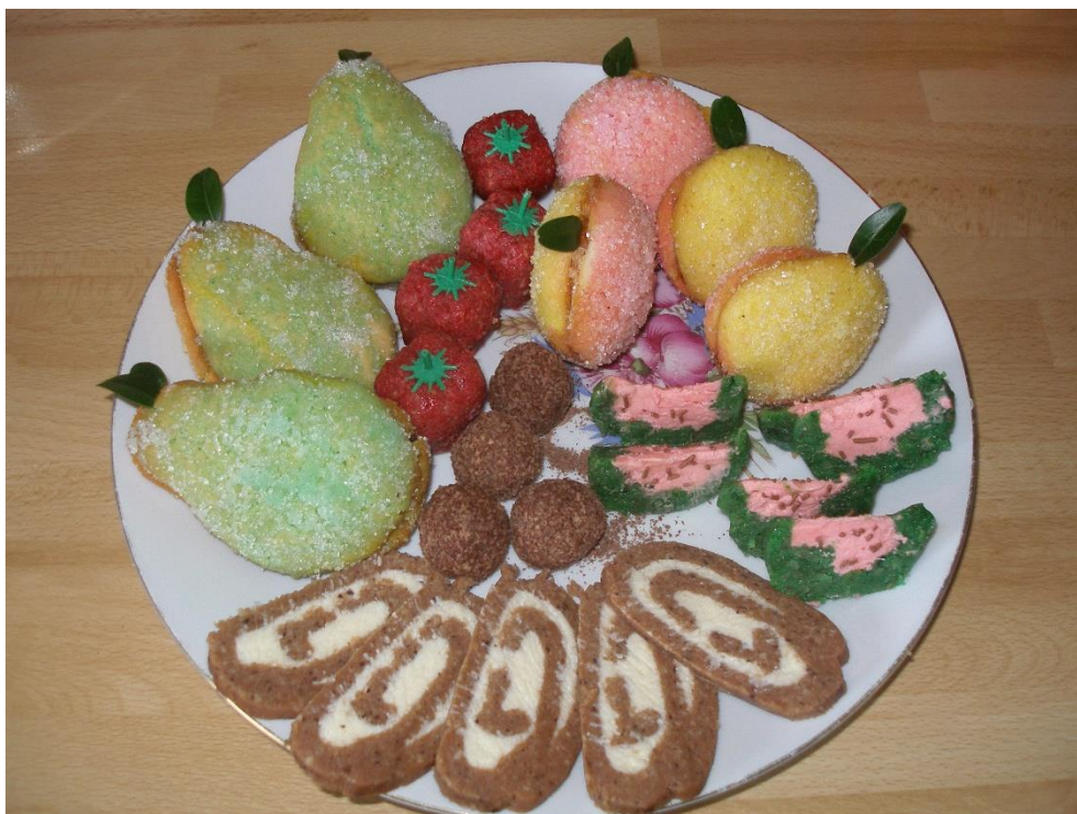
Obr. 9: Tradičné srbské koláče na Veľkú noc