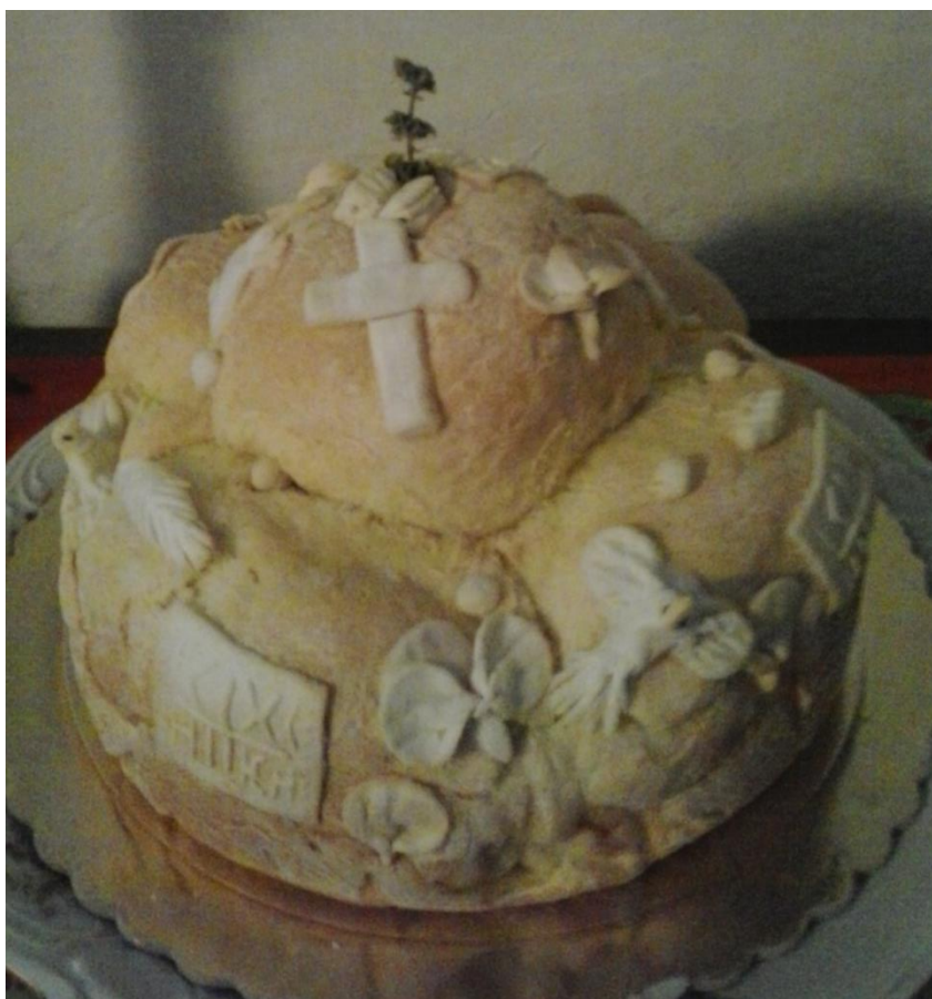
Obr. 12: Slavsky koláč