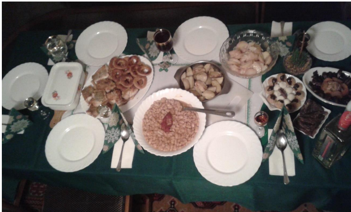
Obr. 1: Vianoce v Srbsku