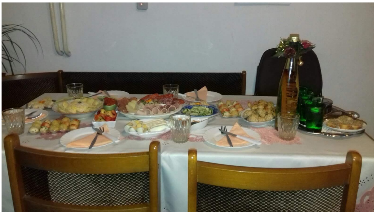
Obr. 11: Slávnostný stôl počas Slavy