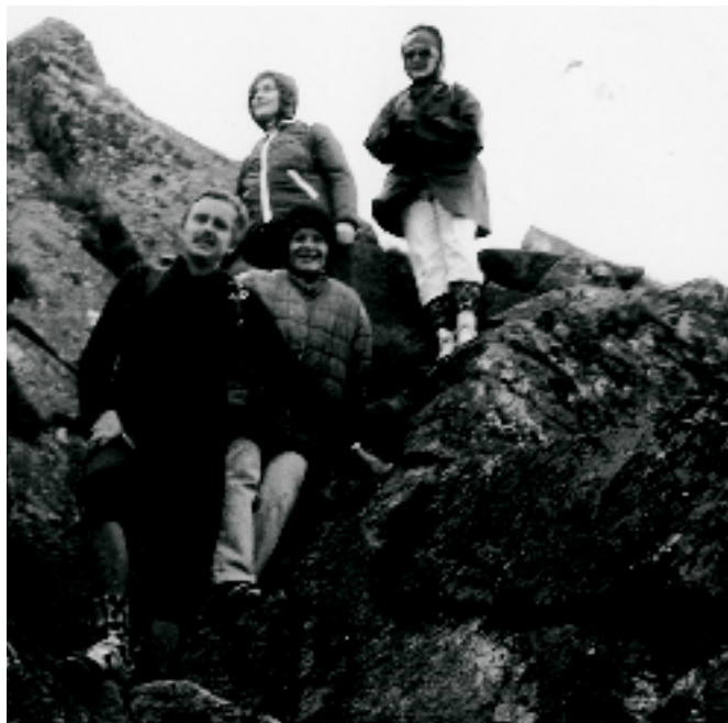
Zájazd členov KSK na Oravu z roku 1983