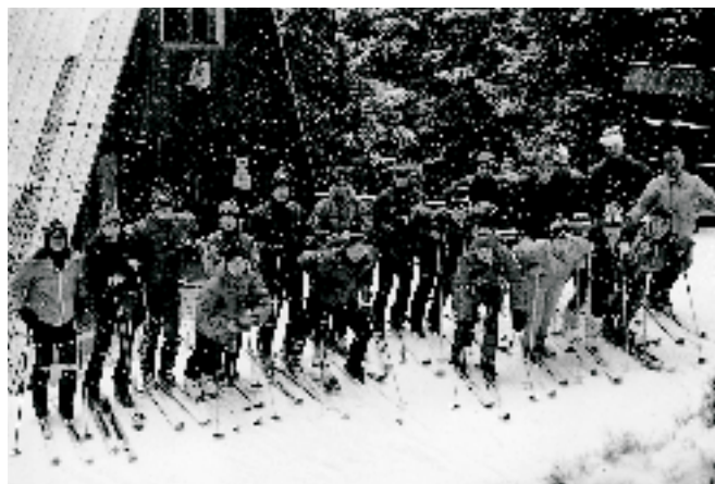
Lyžiarsky kurz členov KSK z roku 1988